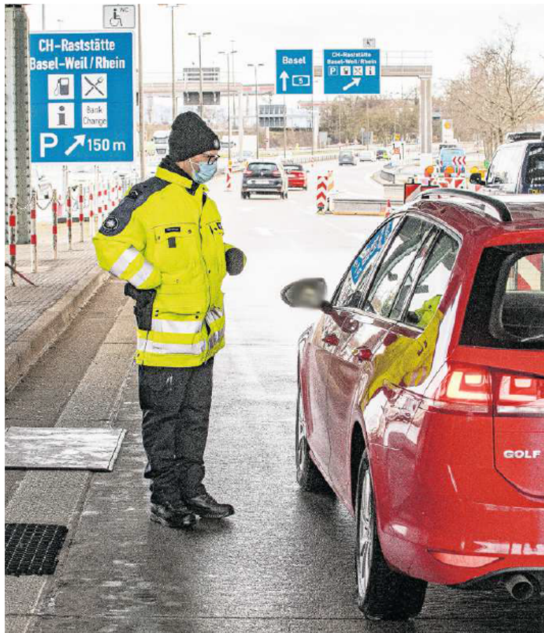
Werden die Forderungen umgesetzt, wird es am Zoll bald viel zu tun geben.

Am Montag äusserten sich nun unter anderem der gesamte Basler Regierungsrat, alle Basler Parteien sowie die Regio Basiliensis und einzelne regionale Politikerinnen und Politiker zu dem Thema. Die Basler Parteien halten die vorgeschlagenen Massnahmen nicht für besonders nützlich, da im grenzüberschreitenden Verkehr kaum hohe Ansteckungszahlen festge-