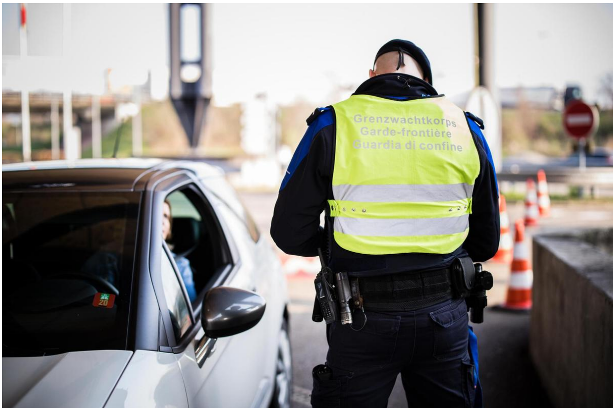
Regio Basiliensis will keine generelle Grenz-Testpflicht.

Die Umsetzung der Forderungen würde den Grenzverkehr sowie die Ein- und Ausreise nach Frankreich und Deutschland de facto zum Erliegen bringen, teilte die Regio Basiliensis als Reaktion auf den Vorstoss der grossen Parteien am späten Sonntagabend mit.